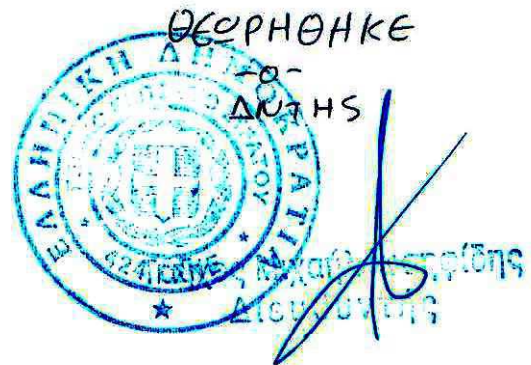
ΜΥ Βακαλόπουλος Άρης ΗΛΕΚΤΡΟΝΙΚΟΣ ΜΗΧΑΝΙΚΟΣ ΤΕ