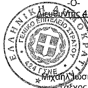
Μιχαήλ Γασηφίδης Ταχός