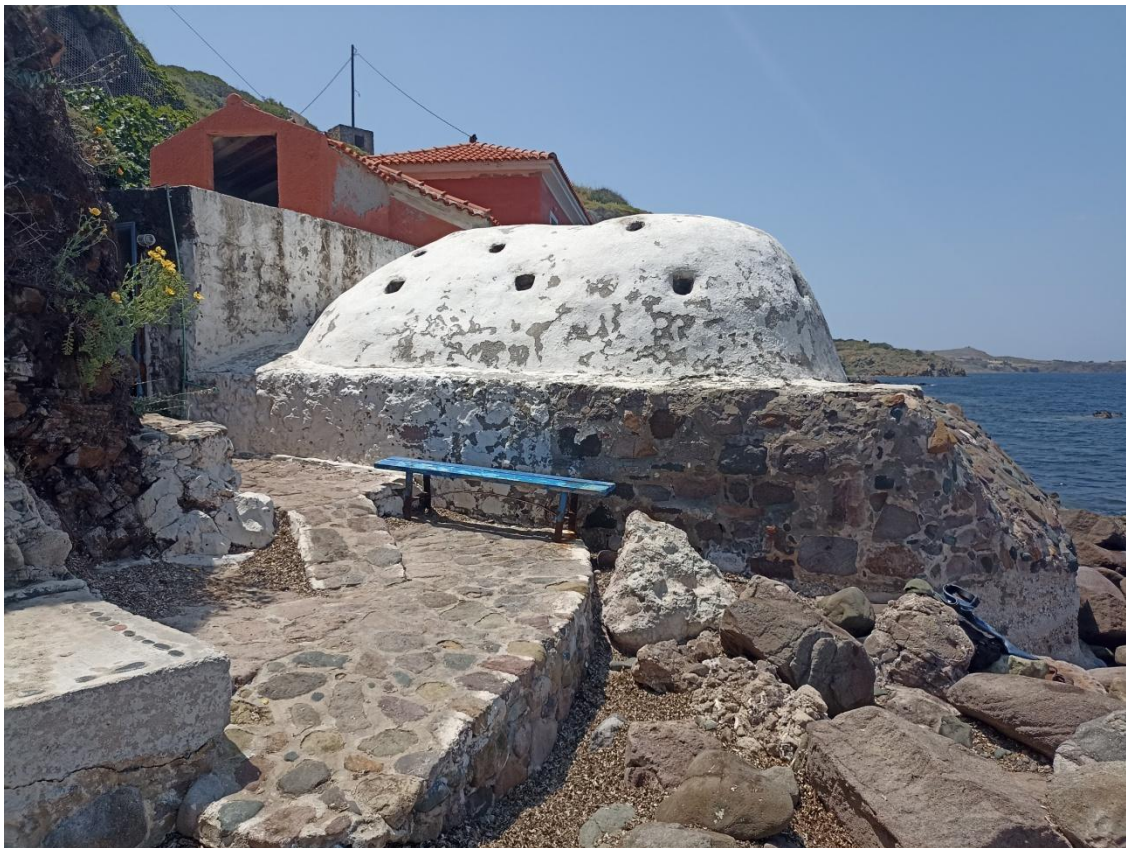
Οι εγκαταστάσεις από την παραλία στα ανατολικά