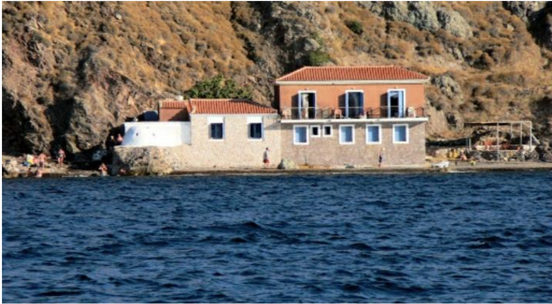
Οι εγκαταστάσεις από τη θάλασσα