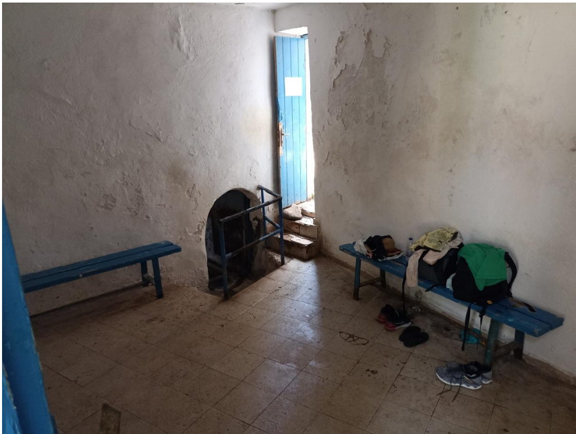
Ο προθάλαμος του οθωμανικού λουτρού