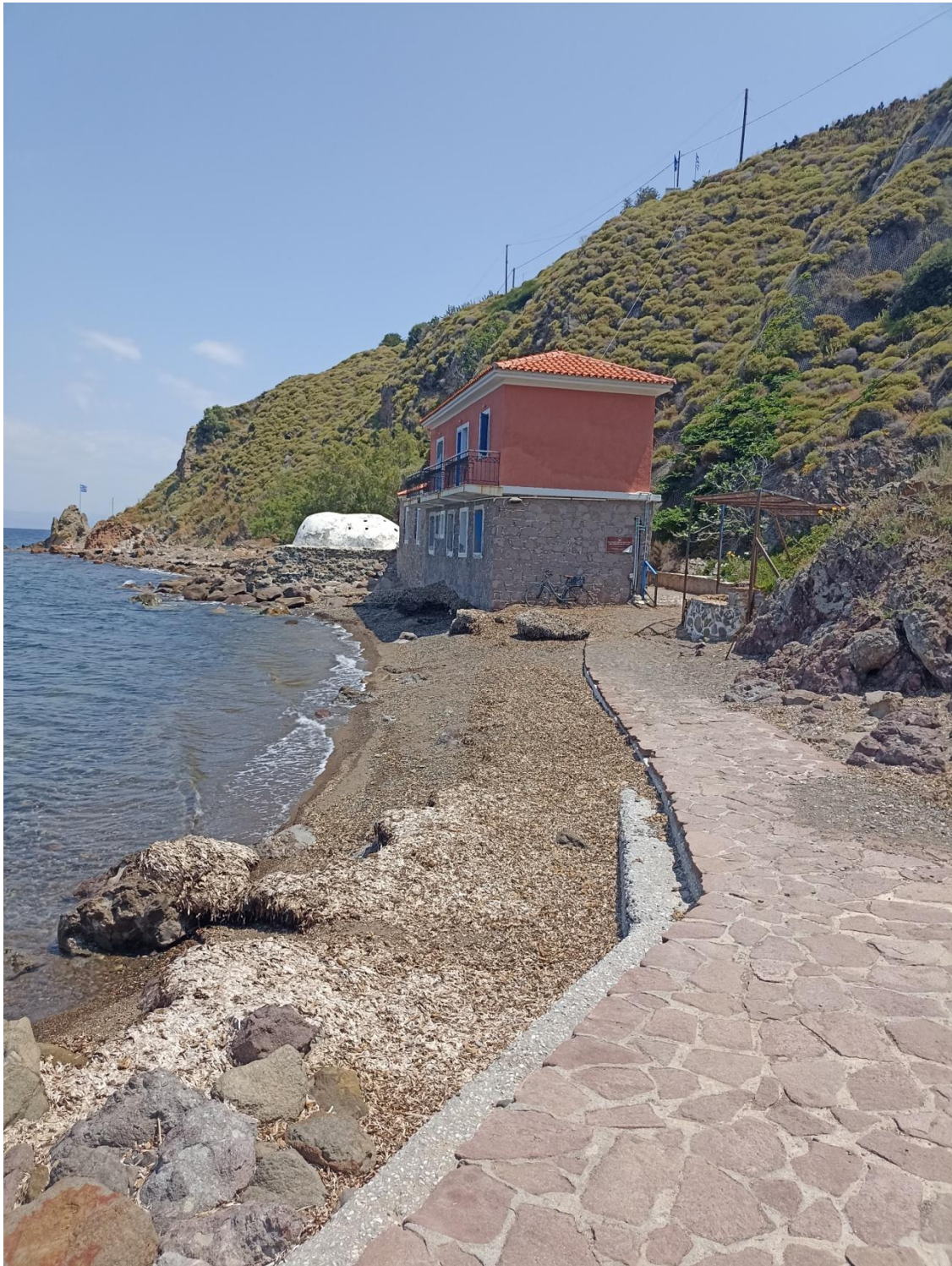
Η είσοδος στο ακίνητο από δυτικά