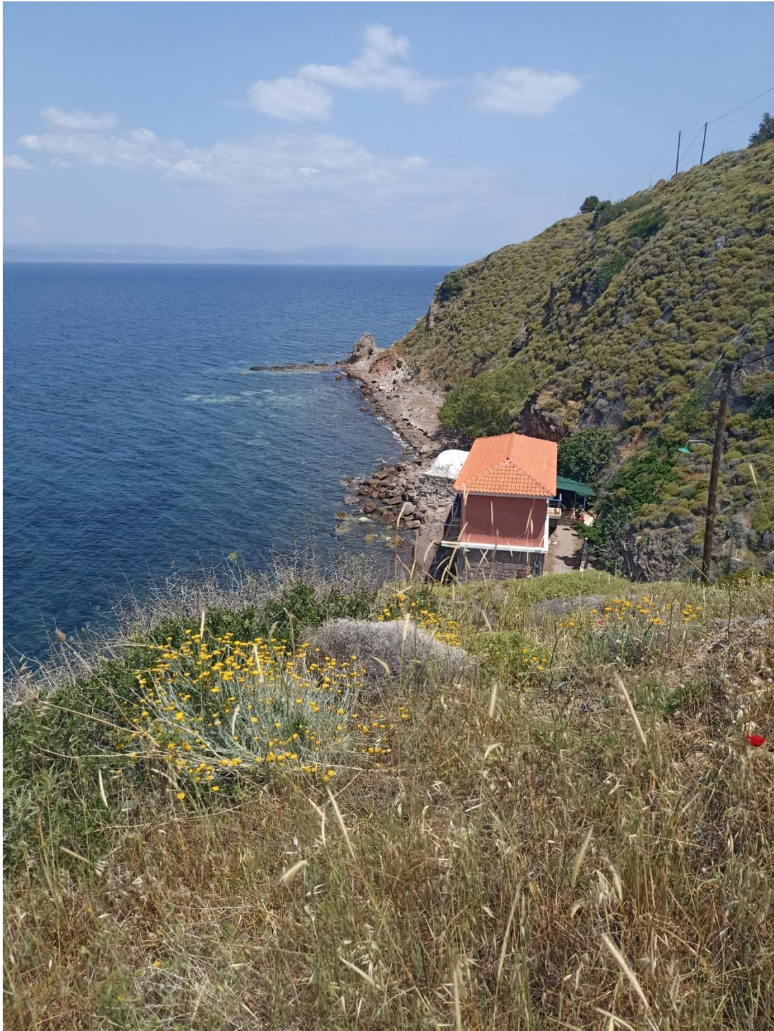
Οι εγκαταστάσεις από το δημοτικό δρόμο