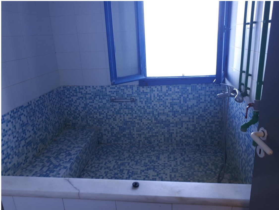
Ατομικό λουτρό ισογείου