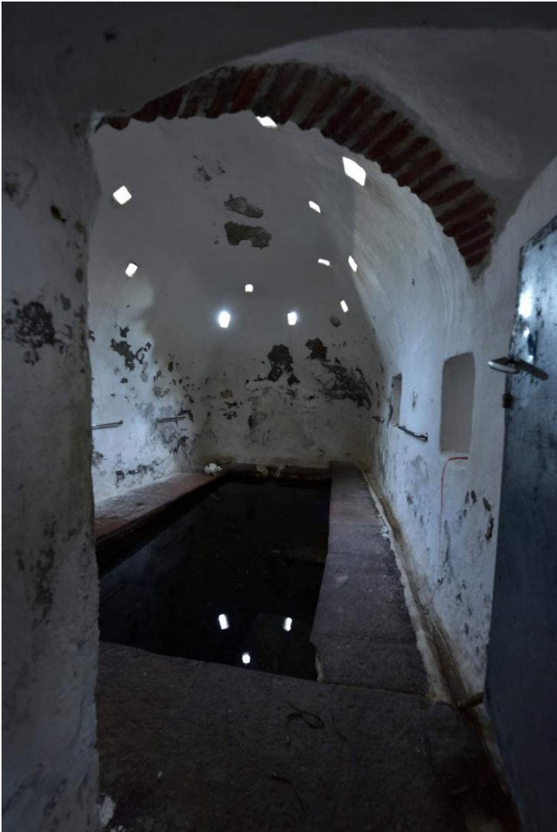
Το οθωμανικό λουτρό