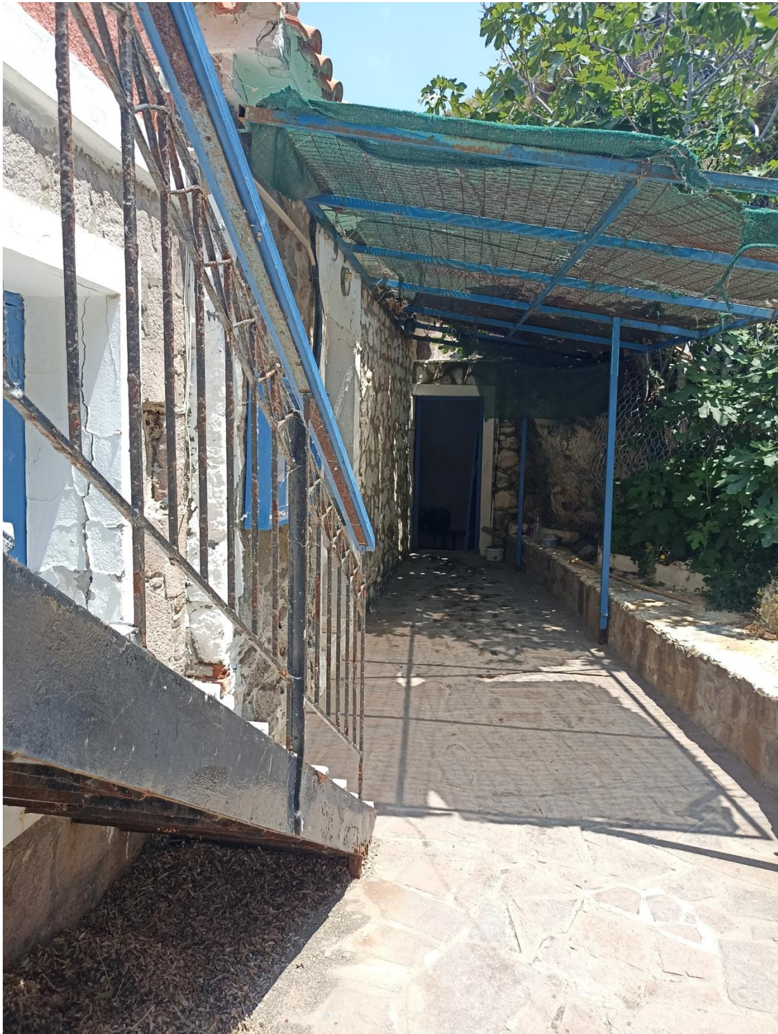
Η είσοδος στα δυο κτίρια