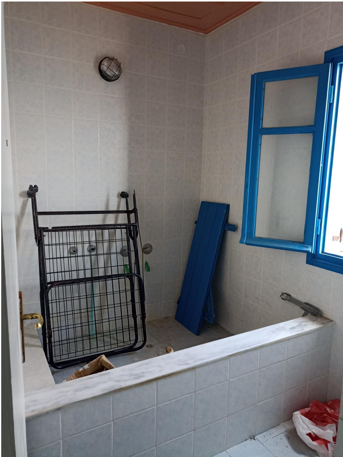
Ατομικό λουτρό ορόφου