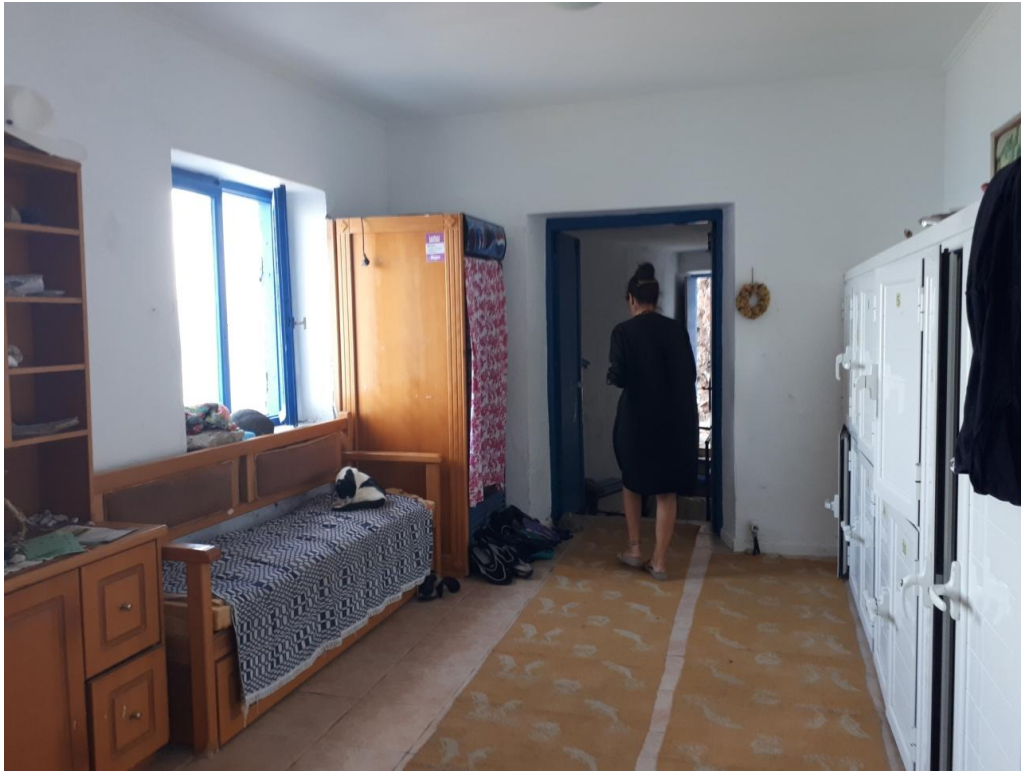
Ο χώρος υποδοχής